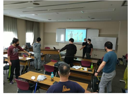
陸上トレーニング講習