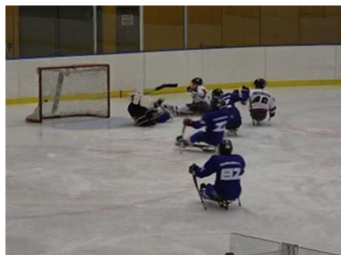
日韓交流戦(北海道・札幌市)