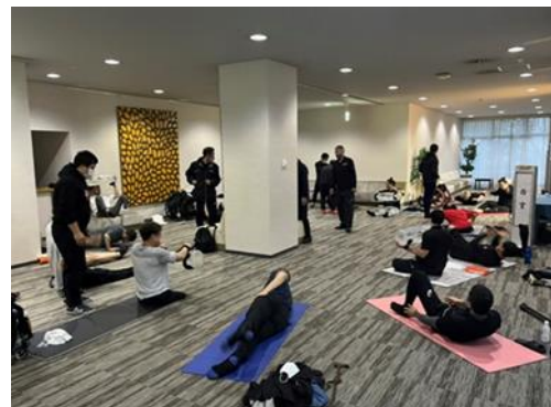
陸上トレーニング