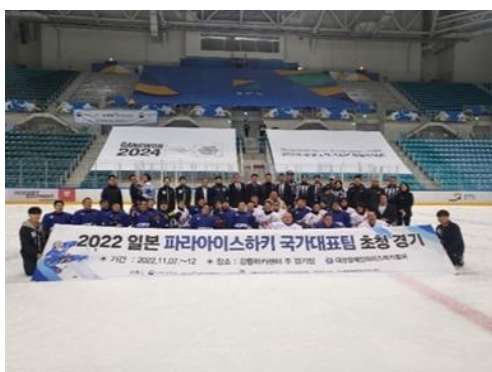
韓国遠征(韓国・カンヌン)