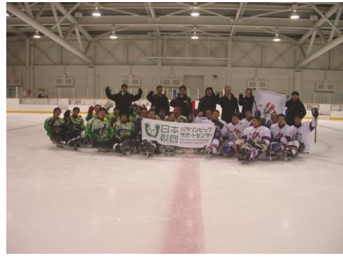
全国クラブ選手権大会開催決勝戦後