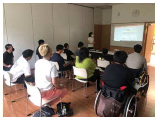
アンチ・ドーピング講習会