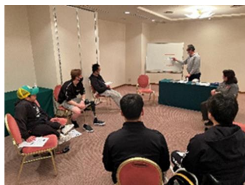
基本的なルールの説明