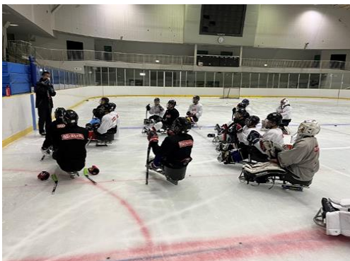
練習メニュー説明