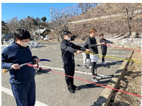
チューブを使ったトレーニング