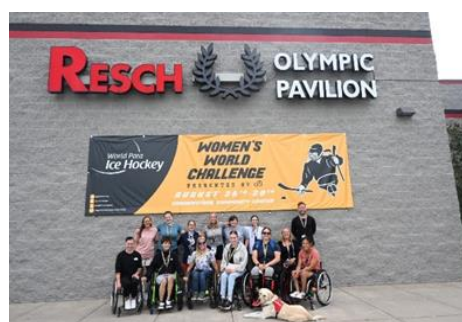
会場のコーナーストーンコミュニティセンター