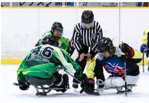
全国クラブ選手権大会