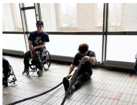
春休みジュニア合宿陸上トレーニング