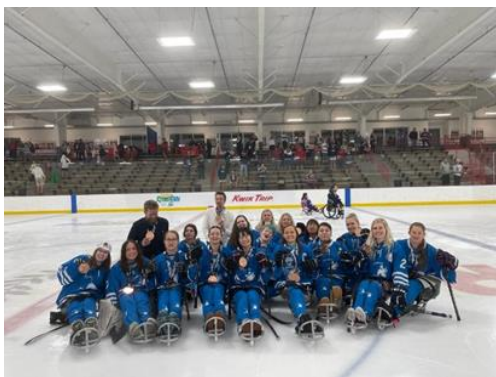
World Women's Challenge Team World

参加者4名全員が、デベロップメントカテゴリーへ移行(40歳男性・30歳女性・13歳男性・11歳女性)