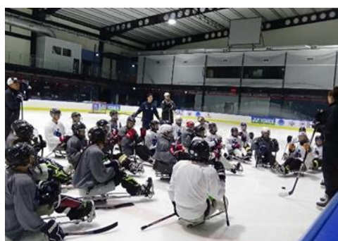
IPCタイスキルキャンプ