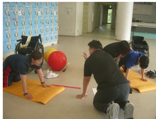
6期生 検証プログラム陸上トレーニング指導