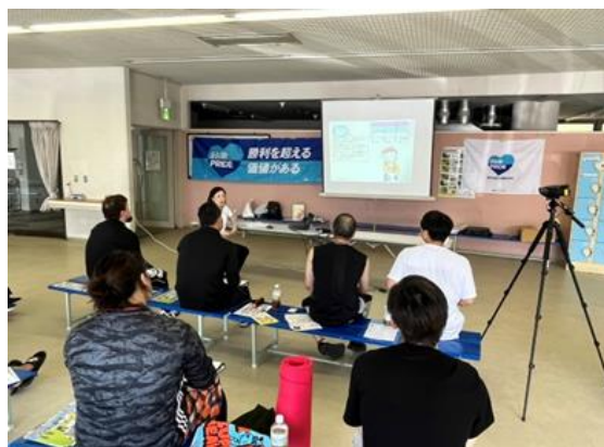
アンチ・ドーピング講習会