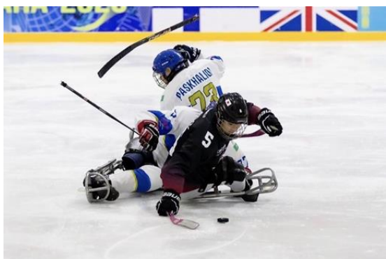
対カザフスタン戦