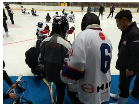
ビッグハット体験会